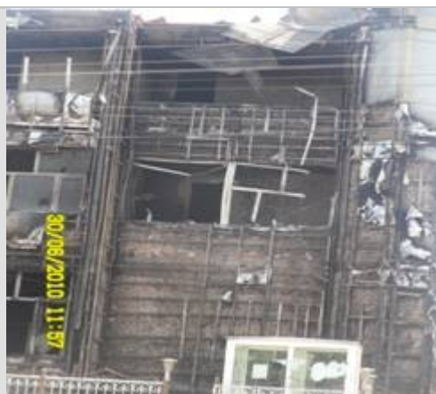
Фото: Состояние клиники «Касият»