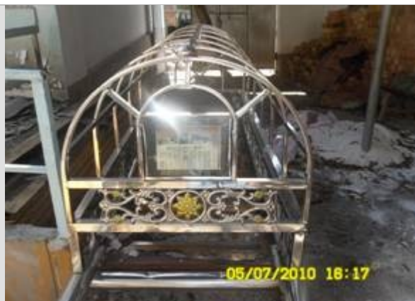
Фото: Настоящее состояние мечети «Шамшад»