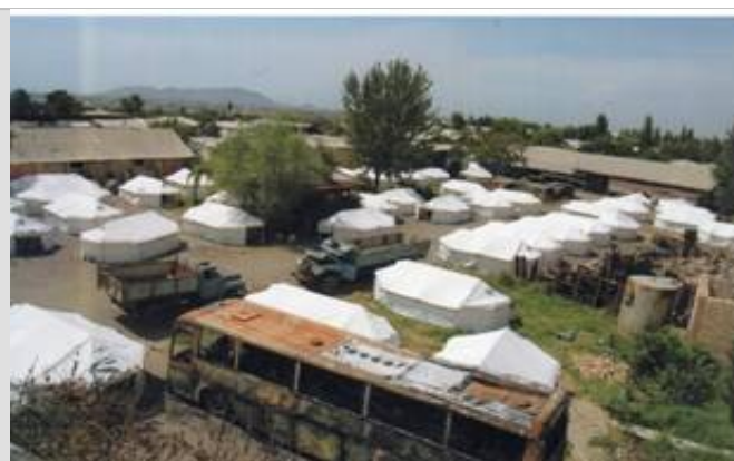
Фото: Палаточный городок жителей Верхне-Увамского района города Оша