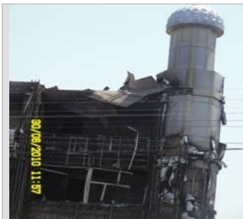
Фото: Состояние мечети «Касият»

На улице Масалиева находится принадлежащая этническим узбекам частная клиника «Касият» с пристроенной к ней мечетью. Со слов очевидцев, 10–11 июня 2010 года в клинику ворвались бандиты. Несколько сотрудниц клиники они изнасиловали, дальнейшая их судьба неизвестна. Клинику вместе с не