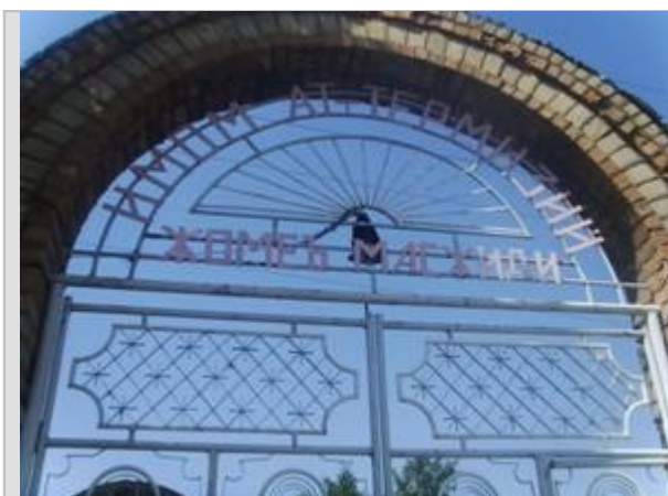
Фото: Ворота мечети «Имом Ат-Термизий»

мечети удалось предотвратить пожар в мечети. В помещениях остались следы поджогов, разбитая бытовая техника.