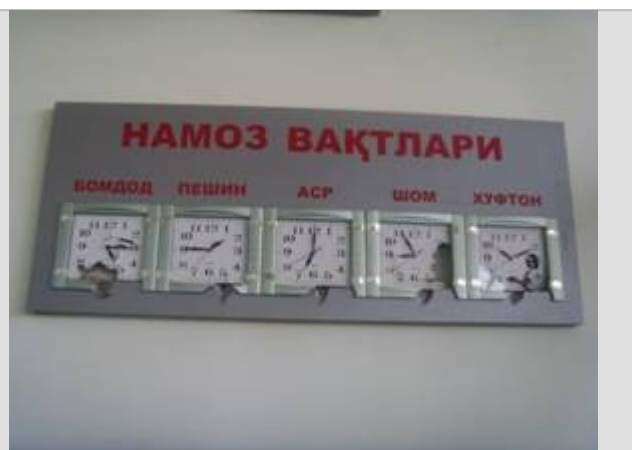
Фото: Следы выстрелов в мечети «Имом Ат-Термизий»